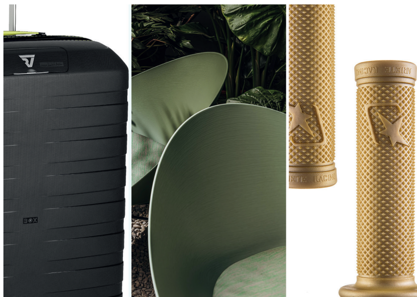
Superfici preziose Le finiture valorizzano gli oggetti e ne migliorano le prestazioni

Texture L'insieme delle qualità visibili e tattili della superficie di un oggetto